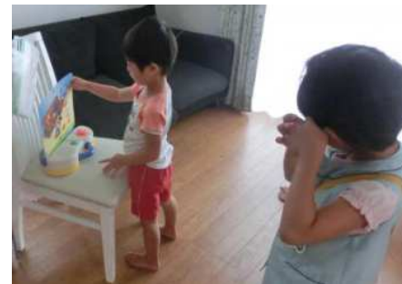
後ろで聞きながら順番待ち中へ

A. これは、私(親)が子供たちが寝た後に取り替えます。もしくは朝、子供たちに「これ、昨日やったよー」と言われてあわてて取り替えます。