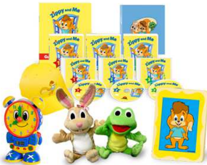
商品内容：DVD3枚、ガイドブック1冊、CD3枚、帽子1個 プレゼント：おしゃべり時計1体、パペット2体、パズル1枚