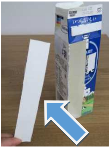
⑥牛乳パックを切る