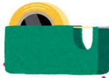
⑦切り口を ⑥の牛乳パックで カバーし、テープで固定